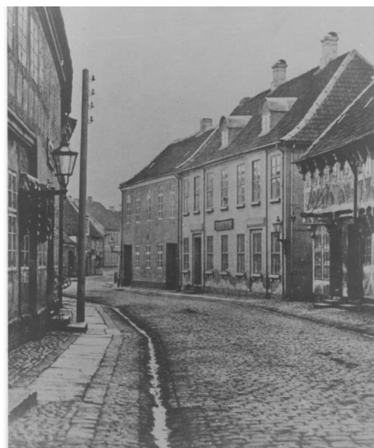
Udsigt mod Quedens Gaard. Fotograf: Bodil Hauschildt omkring 1870. Gengivet med tak til Sydvestjyske Museer, Ribe Nu

I 1774 købte Andreas Quedens Gaard af sin far som havde arvet ejendommen. I 1790 nedriver Andreas de nordøstlige ejendomme af Quedens Gaard, og opfører i stedet det store forhus med sin grundmurede facade mod Storegade indeholdende to rummelige lejligheder og med en facade i nyklassicistisk stil.