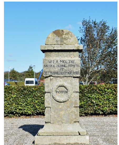
Æresstøtten til minde om Stiftamtmand Moltke

I 1802 blev han af ”det erkendtlige” Ribe, påskønnet for hans indsats for byen og der blev rejst en mindestøtte for ham. Monumentet er i dag placeret ved, indkøbscenteret ved Føtex og Rema hvor vejen er opkaldt efter stiftamtmanden; Moltkes Allé.