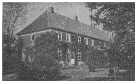
Stiftamtsgården i Puggårdsgade