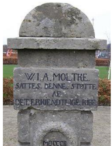
Støtten blev sat af ”det erkendtlige” Ribe